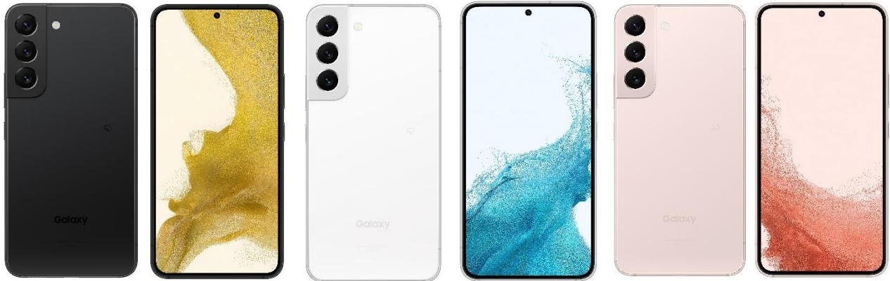
<ファントム ブラック>