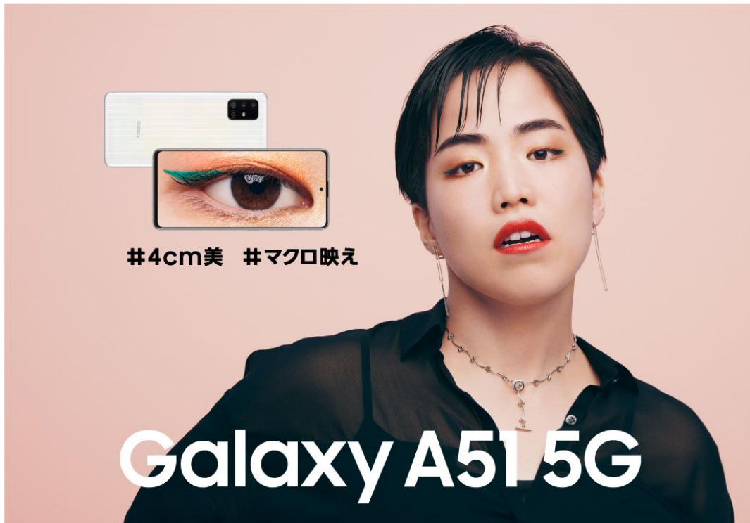
<"4cm 美"スペシャルサイト キービジュアル>

11月19日より公開している Galaxy A51 5G"4cm 美"スペシャルサイトでは、普段見せないモード系のスタイルでマクロカメラを使いこなすゆりやんレトリバアさんを撮影した「Galaxy A51 5G "4cm 美"」WEB CM や、ユニークなリアクション満載の「Galaxy A51 5G meets ゆりやんレトリバア」Special Movie、自身初写真集"4cm 美"デジタルフォト、さらに6人のクリエイターによる Galaxy A51 5G クリエイターズ体験ムービーなどさまざまなコンテンツをお楽しみいただけます。ぜひ、ご覧ください。