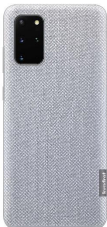
<Gray: 「Galaxy S20+ 5G」>