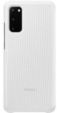
＜White:「Galaxy S20 5G」＞