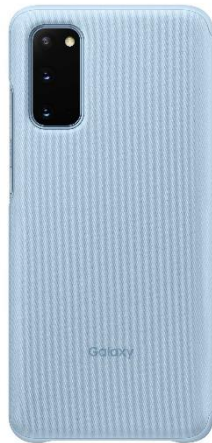
＜Skyblue:「Galaxy S20 5G」＞