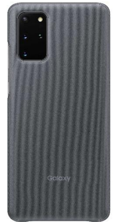
＜Gray: 「Galaxy S20+ 5G」＞