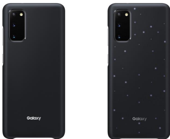
<Black: 「Galaxy S20 5G」>