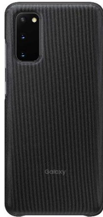
＜Black:「Galaxy S20 5G」＞