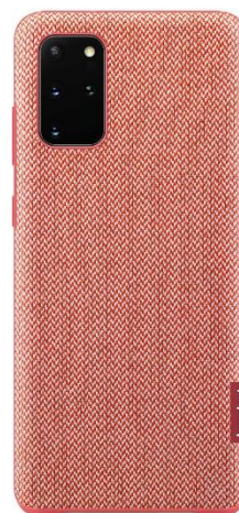
<Red: 「Galaxy S20+ 5G」>