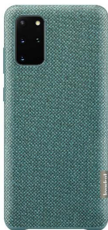
<Green: 「Galaxy S20+ 5G」>