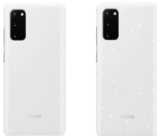
<White: 「Galaxy S20 5G」>