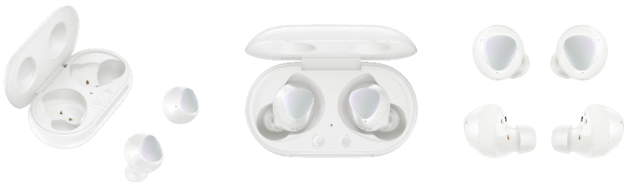
<「Galaxy Buds+ ホワイト」>