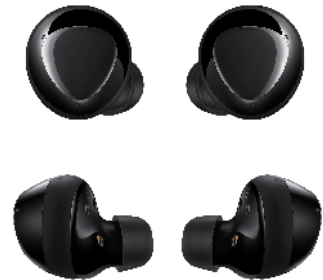
<「Galaxy Buds+ ブラック」>