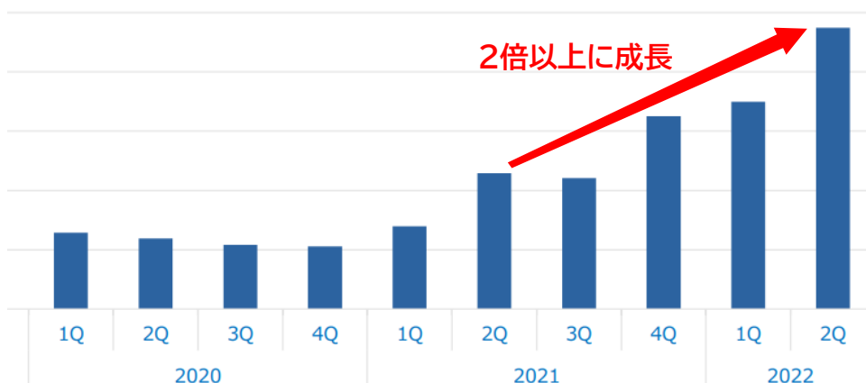
BtoB 越境 EC「SD export」北米流通額推移

新型コロナウイルスの影響が長引き訪日難しい現状で、日本の商品を仕入れるために越境 EC を利用する海外バイヤーは増えています。「SD export」においても、越境 EC 事業全体の流通額は前年同期比で 1.5 倍 *1 と伸びており、特に北米は前年同期比 2 倍以上 *1 に成長している注目の市場です。