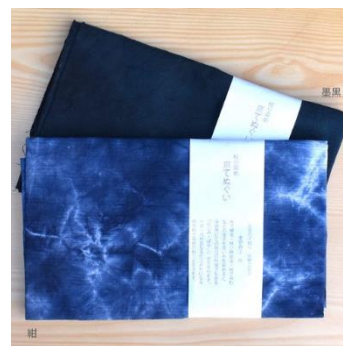
京鹿の子絞りの伝統工芸士 による絞り染め京てぬぐい (株式会社ヨアケ)