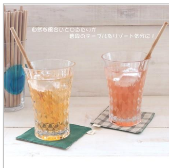
100%天然竹製の 無塗装仕上げのストロー (株式会社若兆)