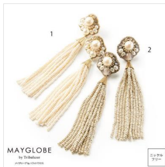
インド伝統の繊細な手作業で 表現したアクセサリー (株式会社スプリング)