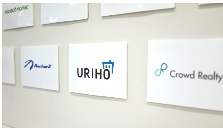
(BeSTA FinTech Lab®に掲示される「URIHO」ロゴ)

トラスト&グロースは、今後も金融機関をはじめとした外部との連携を強化し、事業の拡大を推進してまいります。