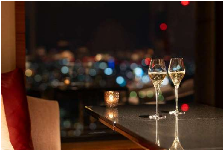
ナイトキャップ イメージ

イブニングシャンパン&カクテルサービスが終わった 20：00 以降のお時間に、厳選ドリンクとスイーツを、大阪市内の夜景とともに楽しみいただけます。