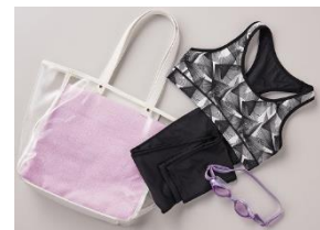
例えば、ブラトップとレギンスを水着代わりにプールでのエクササイズに使えます