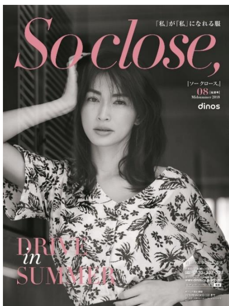
「So close,」 2018 盛夏号表紙

株式会社ディノス・セシル（本社：東京都中野区）は、30～40代の女性に向けてリアルクローズを展開する「ディノス」のファッションブランド「So close, (ソー クローズ,）」より、2018盛夏コレクションを、最新ファッションカタログ、及びディノスオンラインショップ（ https://www.dinos.co.jp/soclose ）で、2018年6月1日に発売します。また、同日同サイトにて、本コレクションのイメージ動画を公開します。