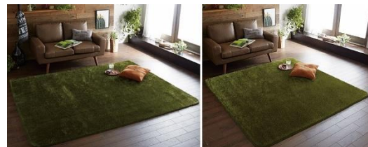
(左)240×185cm サイズ、(右)185×185cm サイズ

長毛と短毛を編み込むことで、より芝生に近い踏み心地を目指しました。 中材にウレタンを使用しているため、クッション性にも優れています。