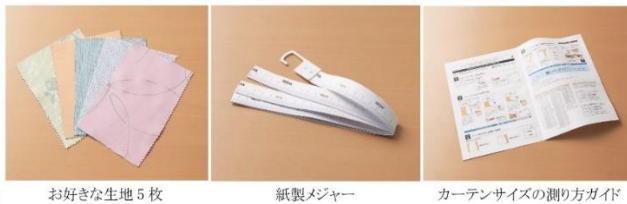
お好きな生地 5 枚

お好きな生地 5 点 (対象商品のみ) までと、採寸用紙製メジャー、カーテンサイズの測り方ガイドのセットでお届けします。