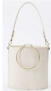
バケツトートバッグ 2,990円