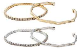
ビジュ&シンプルブレス 2,290円 全面にビジュをあしらったブレス とエッジの効いたクールブレスの 2本セット。