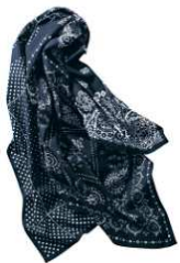
大判バンダナ柄 スカーフ 4,990円