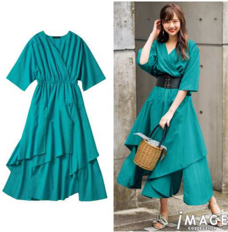
カシュクール風ワンピース 7,990円