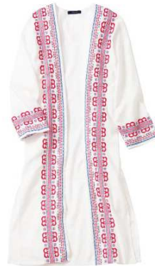
エンブroidアリーガウン 5,990円