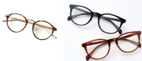
ベッコウ柄ファッション用グラス 1,990円 レトロな雰囲気のポストン型のベッコウ柄 ファッション用グラス。