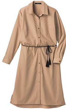
ベルト付きロングシャツ 2,490円~

羽織りとしてもワンピースとしても着回ししやすいシンプルデザインのベルト付きロングシャツ。