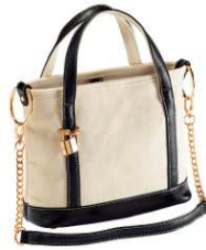
2WAY ミニトート 4,990円