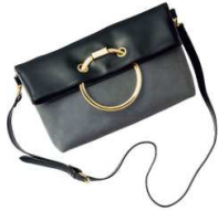
リングモチーフ折れ ショルダー 4,990円