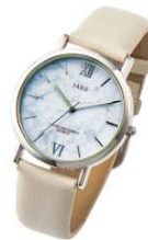
パステルカラー ウォッチ 2,480円