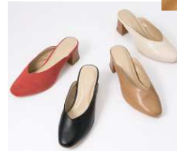
チャンキーヒール ミュールサンダル 2,990円