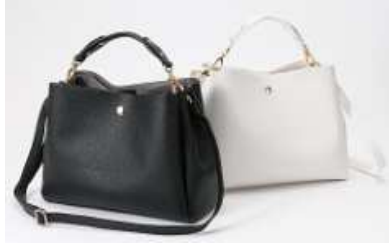
多収納ミニバッグ 3,990円