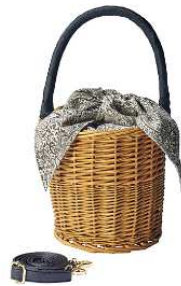
バケツ型カゴバッグ 5,990円