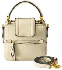
スクエアハンドバッグ 5,990円