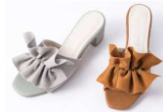
フリルサンダル 2,990円