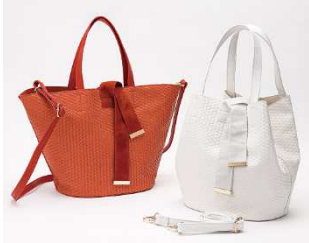
メッシュデザイン2WAY バッグ 3,990円