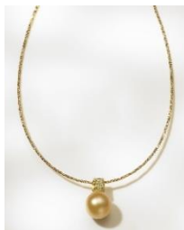
K18 12mmゴールドパール ダイヤモンドペンダント 100,000円（税抜）

このたび新発売の10周年特別企画商品は、真珠層が厚く美しい光沢で定評のあるミャンマー産のゴールドパールを厳選し、10周年にちなみ特別に税抜10万円で発売します。ペンダントは、12mmの大珠バロックパールにダイヤをデザインしたオメガタイプ、イヤリング・ピアスは、左右ともに13mm大珠バロックパールで揃えました。白蝶真珠総生産量のわずか2～3%と言われるゴールドの大珠パールはまさに自然の造化。その優雅で神秘的な艶めきとリッチなゴールドカラーは、装いをラグジュアリーに仕上げてくれるだけでなく、大人の女性の肌を明るく見せる効果も期待できます。