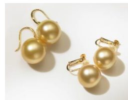
K18 13mmゴールドパール イヤリング・ピアス 100,000円（税抜）

オメガタイプのペンダント。 12mmの大珠バロックパール とダイヤを贅沢に配したラグ ジュアリーな逸品です。