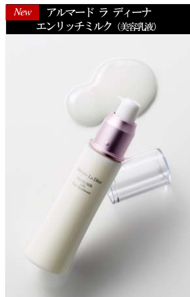
New アルマード ラ ディーナ エンリッチミルク (美容乳液)

セラミド保湿処方 ※1 で卵殻膜 ※1 を留めて、潤いが続く、ハリツヤ肌に。 ずっと馴染んで、しっとり潤う濃厚美容乳液。