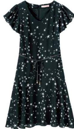
スタープリントワンピース

程良くゆとりがありつつも、コンパクトシルエットで、女らしさと着やすさを両立したGジャン。