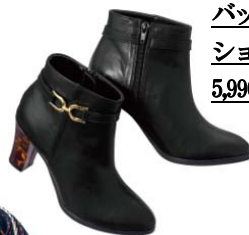
バックル付き ショートブーツ 5,990 円