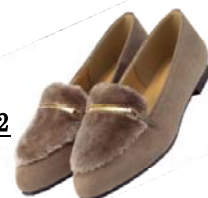
ファー付き カジュアルシューズ 2,990 円