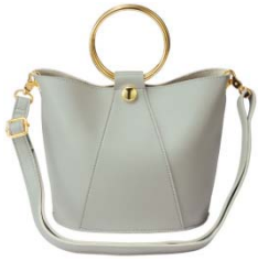
メタルハンドルバッグ 4,990 円