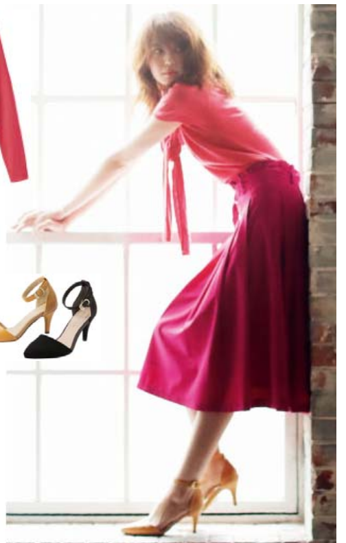
ニットカーディガン&プルオーバー