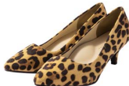
ボローニャ ローヒールパンプス2 2,990 円