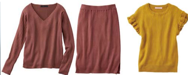
ワイドリブニットセットアップ 6,990円

程良いフィット感が女性らしい、ニットセットアップ。ワイドリブの縦ラインで美シルエットに。ピターなカラーが秋の雰囲気にもマッチする一枚。