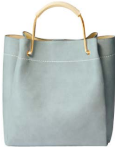
2ハンドルショルダー バッグ 4,990 円