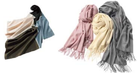
ブロックチェック柄 スカーフ 2,990 円