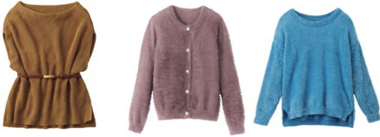
ベルト付きニットベスト 3,990円 (写真左)

肩を包むようなボックスシルエットのニットベスト。やや長めの丈で、付属のベルトでブラウジングも可能。