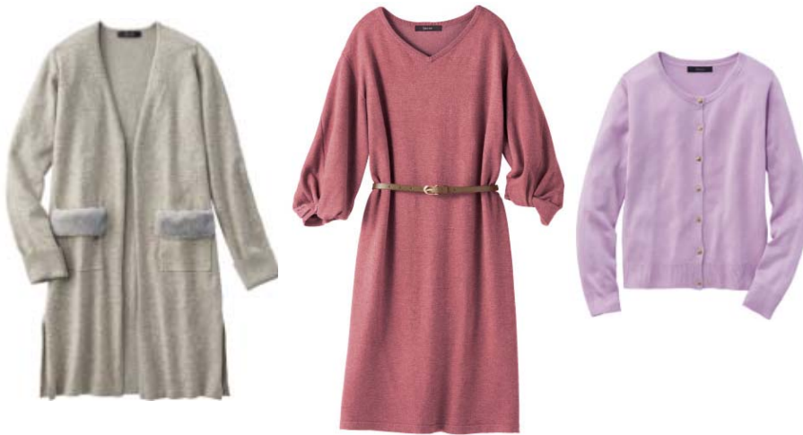
エコファー使いカーディガン