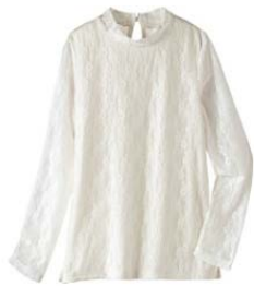
総レースブチハイネックカットソー

きんちゃく付きで使いやすい、ショルダーバケツバッグ。フロントのリボン風デザイン、紐先のゴールド金具がアクセントに。