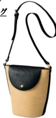
Legato large バケツ型 ショルダー 3,200 円