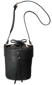
フロントリボンショルダーバッグ

ラップル袖や、裾をフレアで切り替えた揺れ感たっぷりのワンピース。手描き風の星柄や、グログランリボン先の星型チャームがポイント。