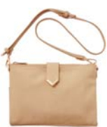
W ポケットミニショルダー 4,990 円

荷物の仕分けに便利なダブルポケットに、中央のオープンスペースには財布代わりにも使えるカード入れ付き。