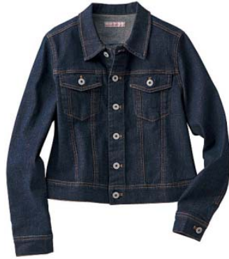
Gジャン 4,990 円

程良くゆとりがありつつも、コンパクトシルエットで、女らしさと着やすさを両立したGジャン。