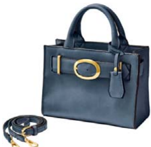
チャーム付きバックルデザイン ショルダー 5,700 円