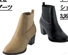
サイドゴア ショートブーツ 3,990 円