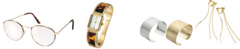
ラウンドフレームファッション用グラス 1,990 円

丸いレンズ&細めのフレームで顔なじみが良く、コーデに可愛い抜け感を演出するファッション用グラス。