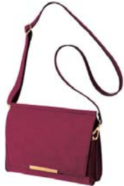
フラップ mini ショルダー バッグ 4,990 円