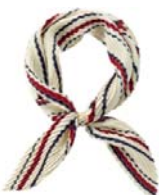
プリーツ カーフ 2,600 円