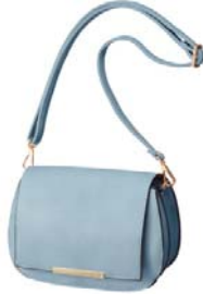
ミニショルダーバッグ 4,990 円