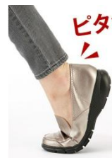
▲柔らかい素材が足にフィット