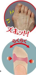
裏面までしっかりと360度サポート↓