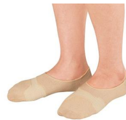
中足関節周りを締めてアーチをサポート→