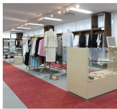
DAMA お客様サロン1号店(東京)