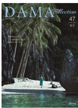
ダーマ・コレクション2017夏号