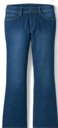
ウォッシュブルー

(左) 太ももまわりはほどよくフィット、ひざから裾にかけてほどよいゆとりのあるシルエット。