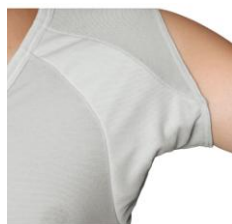
前面を覆う大きなパッドを内蔵し、汗を幅広くキャッチします。

汗の出やすい脇の前部分にパッドを内蔵し、肩部分はノースリーブに見えるセシールオリジナルのパターン設計『前汗キャッチャー®』が、レディースインナーに続いて、メンズでも登場。脇汗をしっかり吸収し、アウターへの汗ジミをブロックするため、暑い日でもスマートに快適に過ごせます。