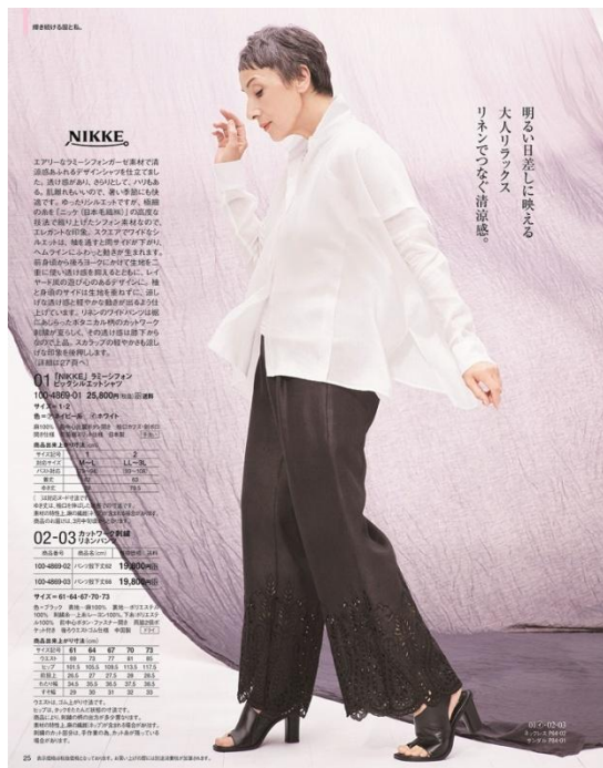
明るい日差しに映える 大人リラックス リネンでつなぐ清涼感

膝下から透け感のあるカットワーク刺繍をあしらった、夏らしく涼しげな九分丈のリネンパンツ。ほんのりワイドシルエットで、旬のスタイルを楽しめます。