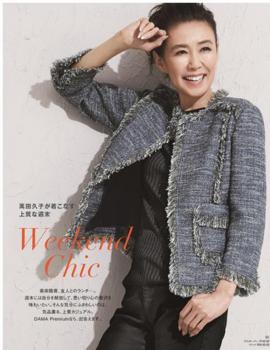
萬田久子が着こなす 上質な週末