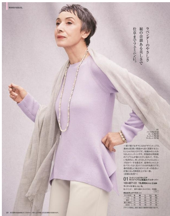
ラベンダーのやさしさ、 裾の余韻ある美しさ 仕草までエレガント

01 02 03 04 05 06 07 08 09 10 11 12 13 14 15 16 17 18 19 20 21 22 23 24 25 26 27 28 29 30 31 32 33 34 35 36 37 38 39 40 41 42 43 44 45 46 47 48 49 50 51 52 53 54 55 56 57 58 59 60 61 62 63 64 65 66 67 68 69 70 71 72 73 74 75 76 77 78 79 80 81 82 83 84 85 86 87 88 89 90 91 92 93 94 95 96 97 98 99 100