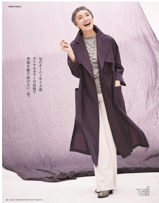
旬のオーバーサイズ感 ロイヤルカラーの品格で 季節を駆け抜けた一着

光の加減によって表情が微妙に変化する、艶めくマフシルクオーガンジーは、世界でも定評のある「ニッケ(日本毛織(株))」が織り上げたもの。ロングコートでありながら、羽織るだけでドレスを思わせるラグジュアリー感に魅せられます。