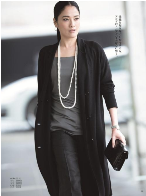
洗練を知り尽くした今ゆえに、アコヤのシンプルパールが心に響く。