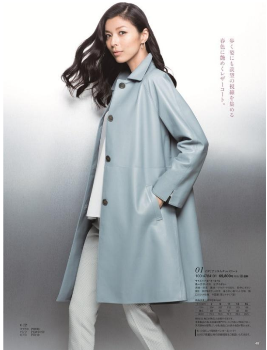
歩く姿にも羨望の視線を集める 春色に艶めくレザーコート。

澄んだ光沢と整ったきめ、しっとりとした柔らかなタッチが上質さを物語るイタリア産ラムレザーを使用した、シングルボタンのステンカラーコート。接ぎ部分に厚みがでないように仕様を駆使し、シームレスで軽しなやかに仕上げています。