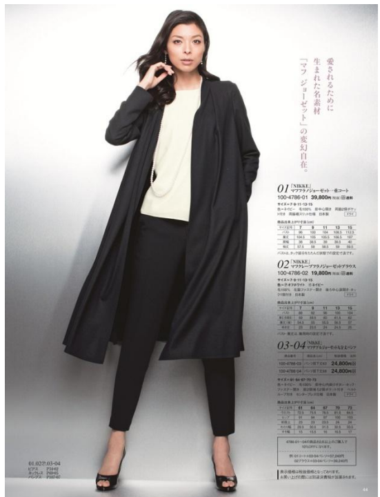
愛されるために 生まれた名素材 「マフジョーゼット」の変幻自在

しっかりとした厚みのダブルジョーゼットを使用。優しい着用感と落ち感による美脚ラインがポイントです。