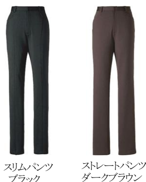
スリムパンツ ブラック

「ストレッチエナジー®」素材のパンツをはいて歩行運動する前（左）と、運動後（右）温度の比較。 ※検証データ：旭化成（株）商品科学研究所調べ