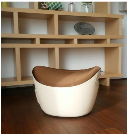
見た目は、インテリア性の高いツール

お腹周りには19種類もの筋肉があり、運動してもそれら全てを使うのは難しいといわれていますが、8の字運動をすることで、インナーマッスルもアウトマッスルも含めた19種類の筋肉を刺激できることから、お腹周りがキュッと引き締まります。