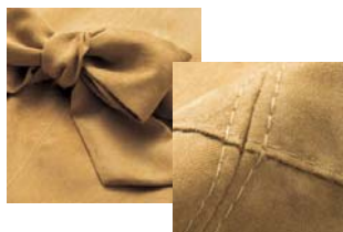
同色系ステッチ&リアル感のある スエード調生地