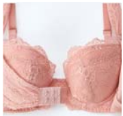
バストを内側にぐっと寄せる盛り胸ホック

可愛い見た目ながら脇高&Wボーン、ハの字パターン、肉厚パッドなど盛り胸テクが満載のアイテム。フロントにある、バストを内側に寄せる盛り胸ホックが、丸いバストに導く「盛り胸力」を強化します。