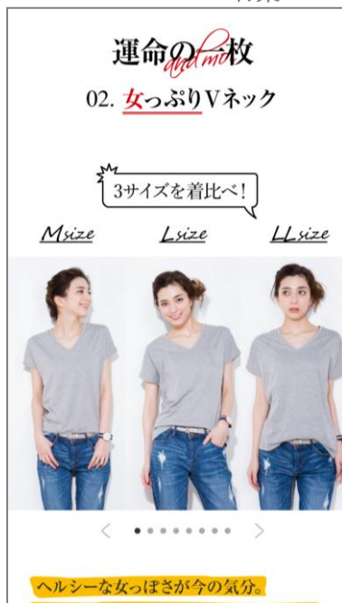
<特集ページイメージ>

リニューアルサイトでは、メインページをSNSのタイムライン風にデザイン。新着情報が常にトップに配置され、スクロールすることで定期的に更新される特集企画や新商品、売れ筋ランキングなどさまざまな情報を確認できます。起用モデルも刷新し、アイテム着用画像やイメージカットも多用。見て楽しく、分かりやすいサイトを目指します。