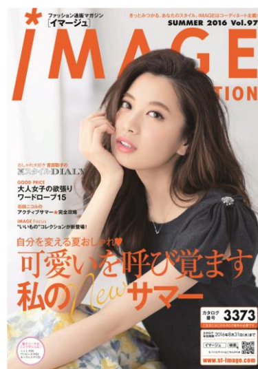
『イメージコレクション 2016 SUMMER』 カタログ表紙

このほかにも、夏のおしゃれに活躍するUV対応の洗える多色展開のカーディガン、大人顔のデザインTシャツシリーズ、冷房対策にもなるトッパーカーディガン、オンもオフも重宝する高機能なトートバッグ、安定感と美脚デザインを両立したサンダル、薄着の季節に最適で涼しさとおしゃれな機能をプラスした人気インナーの夏限定バージョンなど、豊富なファッションアイテムをラインナップします。