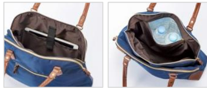
タブレット等を衝撃から守るウレタン入りポケット