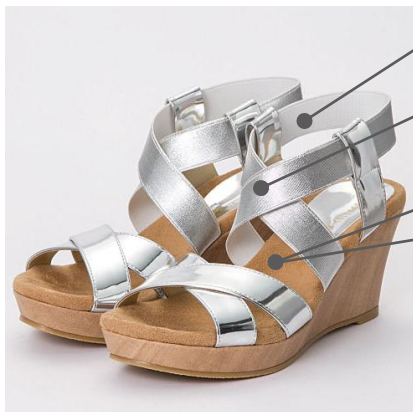
ホールド感と着脱が楽なアンクルベルト

【新作 クロスデザインサンダル】 ゴム仕様のアンクルベルトにより安定感が高まった、美脚がかなうウエッジサンダル