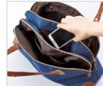
センターには、ファスナー開閉なしのポケット