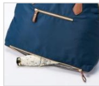
背面下部に折りたたみ傘が隠れたまま入るポケット