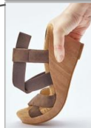
柔らかく曲がる返りの良いソールを採用。さらにクッション性の高い中敷きにより履き心地の良さがアップ。