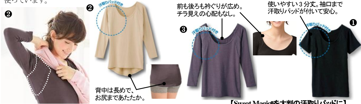
【Sweat Magic®を大判の汗取りパッドに】

空気は通して汗は通さない、セシールオリジナルの「スウェットマジック®」の生地を、大判の汗取りパッドに使用したインナーが新登場。前脇から腕、背中近くまでカバーします。身生地はなめらかで暖かなストレッチ天竺素材を使っています。