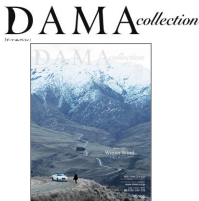
『ダーマ・コレクション 2013冬号』 71万部/196ページ/A4変形判 人生のキャリアを重ねた女性を美しく見せる上質素材とシルエットの融合。 http://www.dinos.co.jp/dama ※WEB SHOPのURLも9月20日 更新

●真冬のリッチカジュアル フォックスファー付き ハウンドトゥース柄ビッグカラーコート ¥29,900(税込)