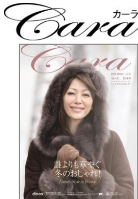
『カーラ 2013 冬号』 113万5000部/180ページ/A4変形判 上質感やしなやかな感性にこだわった洗練リアルクローズ。 http://www.dinos.co.jp/cara ※WEB SHOPのURLも9月20日 更新

「デイノス」はこれからも、ほどよく流行をおさえながら、それだけにとどまらない上質な素材やシルエットにこだわったファッションを提供してまいります。