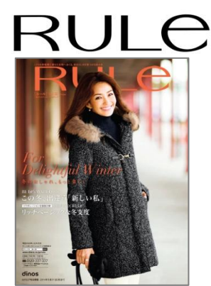
『ルール 2013 冬号』 100万部/148ページ/A4変形判 25歳からのアクティブな女性に向けたカジュアルファッション。 http://www.dinos.co.jp/rule ※WEB SHOPのURLも9月20日 更新