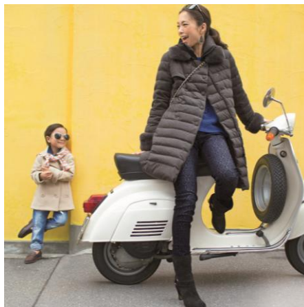
●We Love Fashion レキスファー付ジャージーダウンコート ¥19,900 (税込)