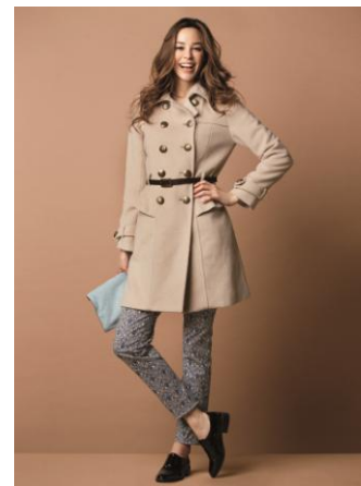
●Standard Plus1 ベルト付きトレンチ風コート ¥24,900 (税込)