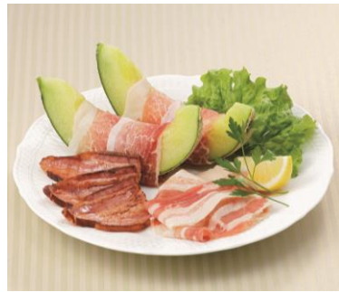
◆甲州信玄豚 ベーコン&生ハムセット 4,400円(税込) こだわりの「甲州信玄豚」をこだわりの 手法で燻製に。風味の豊かさが違います。 http://www.dinos.co.jp/p/1110416594/