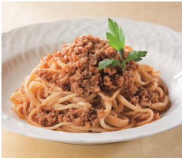
◆銀座「アロマフレスカ」 四元豚の特製ミートソース生パスタセット 5,250円(税込) 素材を生かした料理で魅了する、予約の 取りにくいレストランの味をご家庭で。 http://www.dinos.co.jp/p/1280301332/

【販売商品一例】ホームパーティで大活躍まちがちなしの話の食品・キッチンアイテムが満載