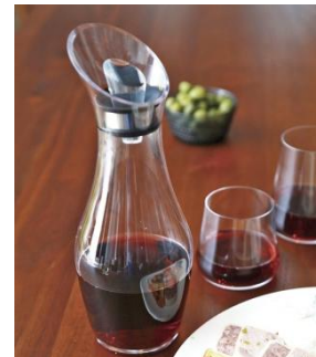
◆menu カラフェ 1L 9,660円(税込) やわらかな曲線が印象的なカラフェ。 手にフィットしやすくデザインされて います。ワインのデキャンタのほかに ウォーターカラフェとしても使えます。 http://www.dinos.co.jp/p/1143600599/