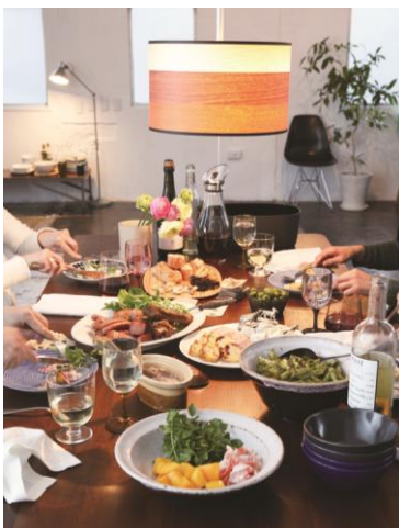
巻頭特集「空想キッチン」より