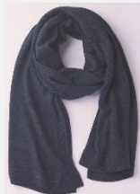
肌寒いときの 防寒具としても使えるストール

女性らしくキレイめな印象の V ネックと、柔らかく優しい印象の U ネックの切り替えて、雰囲気を変化させられるニットワンピース。ネックの切り替えだけでなく、ボタンを開けてさらっと羽織ればロングカーディガンとしても着用でき、幅広いスタイリングが可能です。ニットと同素材の大判ストールは、コーデのアクセントとしても活躍します。