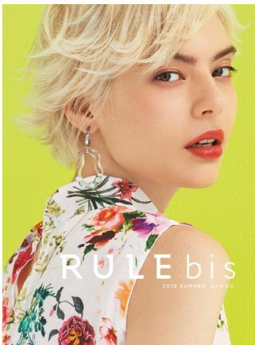
「RULE bis」2019 夏号 カタログ表紙

株式会社デイノス・セシール（本社：東京都中野区）は、「デイノス」で展開する、カラフルな色使いや遊び心が満載のアイキャッチなファッションブランド「RULE bis（ルール ビス）」の2019夏コレクションを、デイノスオンラインショップ上の専用サイト（ https://www.dinos.co.jp/rulebis/ ）にて、2019年4月12日に発売します。