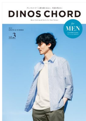
「DINOS CHORD」2019春夏号 カタログ表紙

株式会社 デイノス・セシール (本社: 東京都中野区) は、上質でシンプルなワードローブを展開する、「デイノス」のメンズファッションブランド「DINOS CHORD (ディノスコード)」の2019春夏コレクションを、デイノスオンラインショップ上の専用サイト ( https://www.dinos.co.jp/mens/ ) にて、2019年3月11日に発売します。