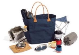
アウトドアシーンにも

日本有数の素材メーカー、小松マテレー社により開発されたコンブナイロン生地を使用した日本製のバッグが新登場。中敷きなしで自立するハリと硬さがありながら非常に軽いのが特長です。持ち手は牛革製でシンプルなデザインのため男女問わず使えます。