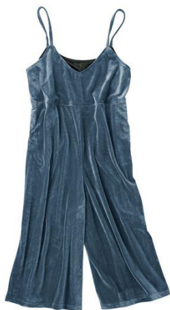
◇ストレッチベロア