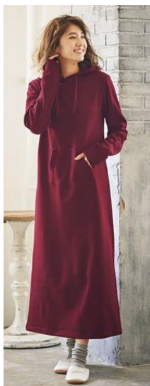
◇裏起毛スウェット