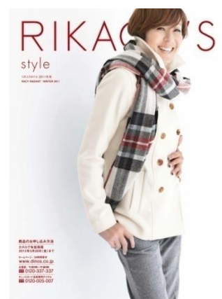
【リカコスタイル 2011 冬号】 35 万部/92 ページ/A4 変形判 シンプル&ハイクオリティな RIKACO が提案する新しい時代のリアルクローズ。 http://www.dinos.co.jp/rikaco