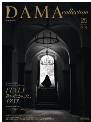
【ダーマ・コレクション 2011 冬号】 66 万部/188 ページ/A4 変形判 上質の素材と大人の女性を美しく見せるシルエットの融合。 http://www.dinos.co.jp/dama

ディノスは、ほどよく流行を押さえながら、それだけにとどまらない上質な素材やシルエットにこだわったファッションをこれからも提供してまいります。