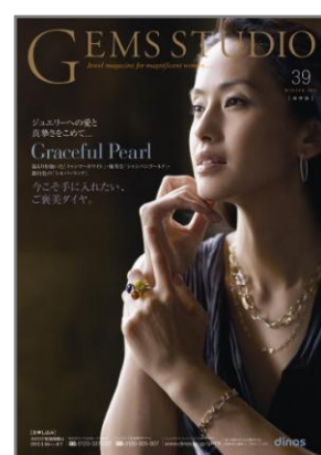
【ジュエルスタジオ 2011 冬号】 20 万部/36 ページ/A4 判 大人の女性のためのジュエリーマガジン。正統派からデイリーユースまで。 http://www.dinos.co.jp/gems