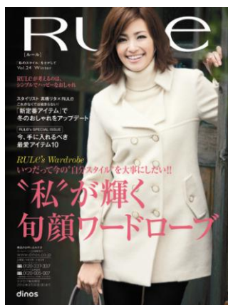
【ルール 2011 冬号】 82 万部/148 ページ/A4 変形判 25 歳からのアクティブな女性に向けたカジュアルファッションを提案。 http://www.dinos.co.jp/rule