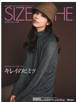
【サイズリッシュ 2011 冬号】 12 万部/68 ページ/A4 変形判 おしゃれを楽しむ、プラスサイズカタログ。着やせコーディネートを提案。 http://www.dinos.co.jp/riche