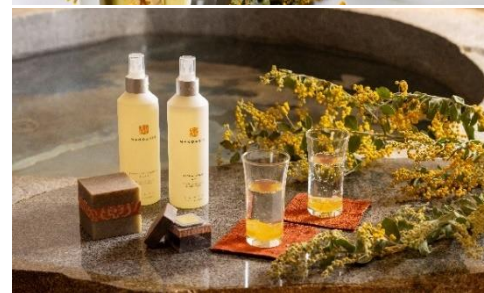
(上)全皿ミモザイエローのディナーコース/(下)Nagomi スパ アンド フィットネス

グランド ハイアット 東京が推進する、SDGs 達成への取り組みの一環として、ジェンダーにとらわれず女性がさらに輝ける社会の実現を願い、国際女性デーの象徴であるミモザから着想を得たメニューをご提供いたします。