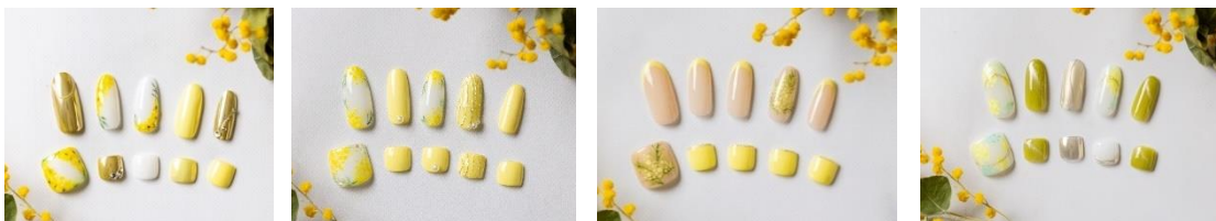
ミモザネイル イメージ

※リムーバル代を別途頂戴しております。また、デザインにより価格が異なりますので、詳しくは店舗へお問合せください。