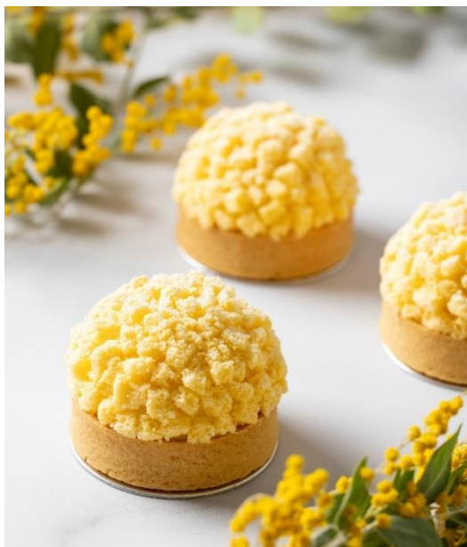
女性パティシエが手掛けるタルト「ミモザ」

都会の喧騒にそびえ立つダイナミックなラグジュアリーホテル、グランド ハイアット 東京(東京都港区、総支配人:ロス クーパー)では、国連が制定する3月8日の「国際女性デー(International Women's Day)」に合わせた限定メニューを、「フィオレンティーナ ペストリーブティック」と、オールデイ ダイニング「フレンチ キッチン」にて2024年3月1日(金)から3月10日(日)まで販売いたします。さらに、「Nagomi スパ アンド フィットネス」では、女性のサポートにも繋がるプロダクト「ZENTS(ゼンツ)」を使用したスパリートメントの特別プランや、ミモザをイメージしたネイルアートを、2024年3月1日(金)から3月31日(日)までご用意いたします。