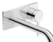
ハンドル部分 No.C11070 埋込部分 No.GK1900