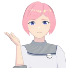
天王寺みおちゃん

働き手の減少による労働力不足が懸念される一方、AI・デジタル技術の進歩が加速しています。働き手の減少、教育コストの増大、カスタマーハラスメントなどの課題解決に向けて、テクノロジーを活用し、業務の効率化や自動化を行うことが求められているなか「AIアバターを導入することで、顧客満足を維持しながら業務の効率化を実現できる」という仮説の検証を行います。本取り組みは、アバターやAI技術に強みを持ち、これまで多くの企業や行政にアバター接客の導入実績を持つAVITA株式会社と共同で行います。