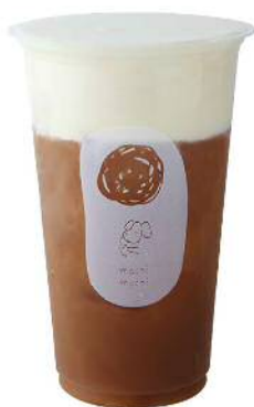
Iron Buddha Oolong Cheese Tea テッカノンチーゼティー