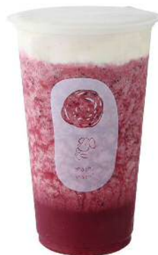
Wildberry Cheese Tea ワイルドベリーチーゼティー