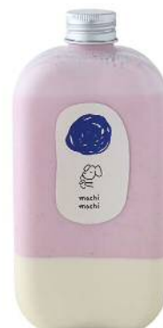
Strawberry Milk Panna Cotta ストロベリーミルクパンナコッタ