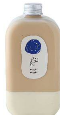
Milk Tea Panna Cotta ミルクティー パンナコッタ