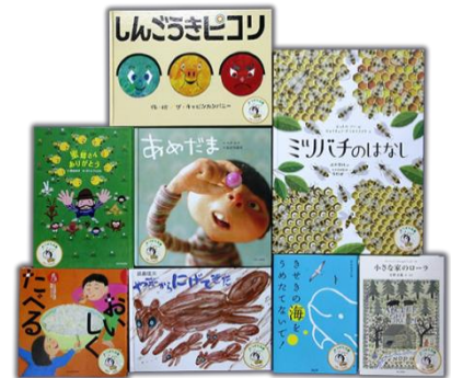
▲前回（第21回）の寄贈書籍

22年目を迎える本年も、2020年4月30日（木）必着にて寄贈小学校を全国より募集します。ご応募いただいた中から抽選で、寄贈先として選ばれた小学校に、応募者の直筆メッセージカードを添えて、書籍セットを寄贈します。