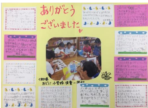
▲小学校からのお礼のお手紙と写真

毎年、「みつばち文庫」の応募者や寄贈先小学校からお礼のお手紙がたくさん届きます。応募者から寄せられる本活動についてのお喜びの声や、小学校で子供たちが楽しそうに本を読んでいる写真から、私たちは本の大切さや本を贈る活動の必要性を感じています。