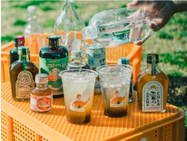
(イメージ) CRAFT COLA hourによるイベント ※当日の銘柄と異なる場合がございます。

五十嵐耕平監督のこれまでの作品を振り返る貴重な資料やグッズ販売を行う五十嵐耕平監督の特集展示を開催します。また、通常メニューとして展開するフレンチトーストに、希少な国内産アボカドトッピングを行ったスペシャルメニューも限定販売します。