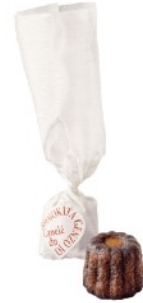
(左) 店舗外観 (右) カヌレ