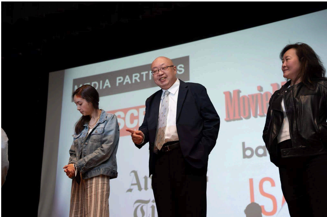
2022年4月、ニューフィルムメイカーズ・ロサンゼルスにて