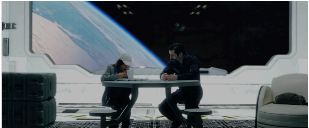
『オービタル・クリスマス』メインビジュアル（左）、劇中カット（右）

「オービタル・クリスマス ～聖夜を祝う全ての人に～」は海外SFの解説者として著名で、自身も小説/脚本/翻訳も手がける堺三保（さかいみつやす）氏が長年構想してきた短編SF映画の実写制作プロジェクトとして、その全製作費をクラウドファンディングによって調達しました。2018年6月30日に開始したプロジェクトは多くの注目を集め、目標金額の400万円を大きく突破。最終的に同年8月31日の終了日まで、国内実写映画史上最高額となる2182万1503円の支援を達成。インディーズ映画ながら、米ハリウッドの俳優と撮影スタッフ、さらに日本のアニメや特撮で活躍するスタッフやスタジオが参加し、本格的な日米合作の意欲作として制作が行われました。