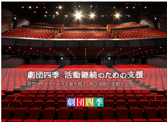
本プロジェクト キービジュアル

リターンが不要な方向けの「応援コース」に加え、『劇団四季 The Bridge ～歌の架け橋～』（2021年上演予定演目）『ロボット・イン・ザ・ガーデン』（2020年上演予定演目）のデスクトップ壁紙・オリジナル便箋フォーマット（PDF）や、『劇団四季 The Bridge ～歌の架け橋～』オリジナルエコバッグ（非売品）、劇団四季のすべての演目でチケット料金のお支払いにご利用いただけるギフトコードのリターンを用意しています。今後も全国の皆様に演劇の感動をお届けするため、ぜひ、応援ください。