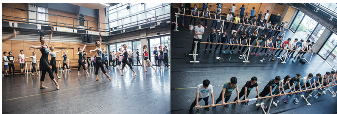
四季芸術センターでのレッスンの様子（2020年2月以前に撮影）