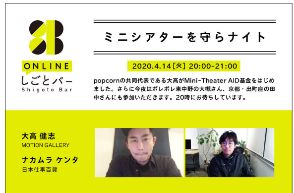
「ミニシアターを守らナイト」ビジュアル

【豪華リターンをご用意！！】 1口3,000円からの「思いっきり応援コース」と、1口5,000円からの「未来チケットコース」の2種類で、「思いっきり応援コース」はお礼のメッセージのみ、「未来チケットコース」は、2020年内まで使用可の映画鑑賞券、有志の劇場で使用できる1000円パス、フリーパスなどが含まれます。また、クラウドファンディング終了後に、ストーリー配信のWebサイト「サンクス・シアター」により、有志の映画人から寄せられた100本以上の作品から、特典購入時の規定本数分だけ鑑賞することができます。深田監督「東京人間喜劇」や濱口監督作品「親密さ」のほか、ソフトになっていない鑑賞機会の限られた作品が多く集まる。片瀬須直が監督を務めた「この世界の片隅に」の未公開ドキュメンタリーや、空族・富田克也監督「バンコクナイツ」、新星・山戸結希監督「おとぎ話みたい」、行定勲監督「うつくしいひと」や諏訪敦彦監督初期の傑作「2/デュオ」など、ファンディング中も随時ラインナップは追加予定となっています。