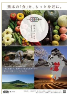
ポスター及び店頭POP