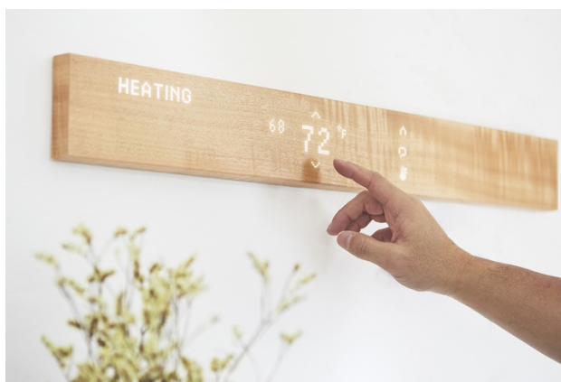
一見「一枚の木」に触れると、メッセージの交換、ニュースや天気予報の受信、音楽再生、スマート家電の操作などを行える

mui Labは、2018年末の Kickstarter にて目標額の達成とベストオブキックstarterを受賞、2019年1月ラスベガスで開催された CES (Consumer Electronics Show) ではイノベーションアワードを受賞、2019年4月にイタリアミラノで開催された「 ミラノデザインウィーク2019 」では株式会社ワコムと新企画のアートシステム「柱の記憶」を共同出展し、世界中のメディアを通じて多くの関心を寄せていただいております。