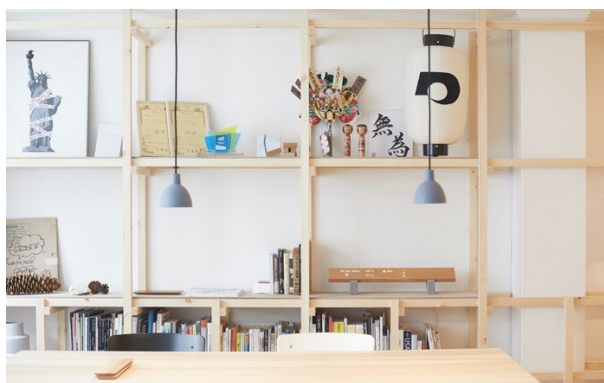
京都の400年続く家具街「夷川通」に構えたmui Labの新オフィス