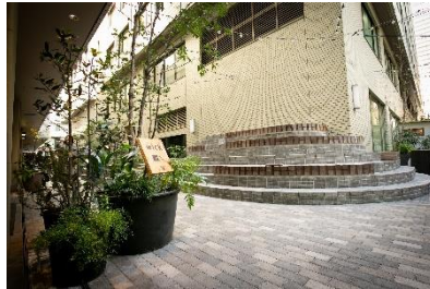
Slit Park YURAKUCHO