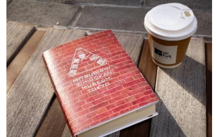
「新しい私に出会うカフェ」イメージ

また期間中、協力書店の丸善 丸の内本店等3店舗で、手軽にコーヒーを楽しむLIGHT UP COFFEEセレクトの「コーヒーバッグ」を販売します。