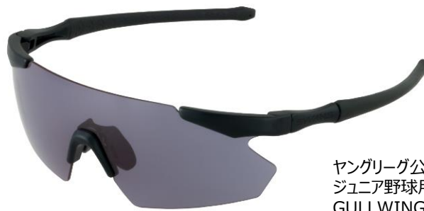
ヤングリーグ公認 ジュニア野球用モデル GULLWING FLEX-S

山本光学では、「紫外線から眼を護るための環境づくり」「快適に着用できる製品づくり」の両面から少年野球選手のサングラス普及に取り組んでまいりました。最近では、長時間日差しの強い球場など屋外での眼の紫外線対策や、特に硬式野球の場合、ボールが眼に直撃したり砂やほこりの対策など安全面からも、その必要性が重視されています。