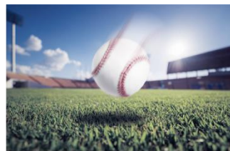
ULTRA LENS あり