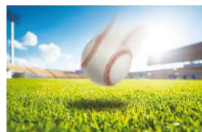
ULTRA LENS なし