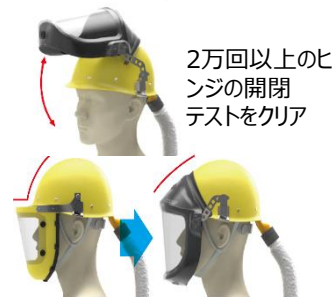
粉じんが侵入しにくい新機構

・2万回以上の開閉テストをクリアした新開発のヒンジ構造を採用。繰り返しの面体の上げ下げでも緩みません。 ・面体を上げ下げしても粉じんが侵入しにくいワンモーションデザインを採用 ・交換パーツのラインナップも充実しています。紛失や消耗する部品も交換しながら使えるため、経済的です。